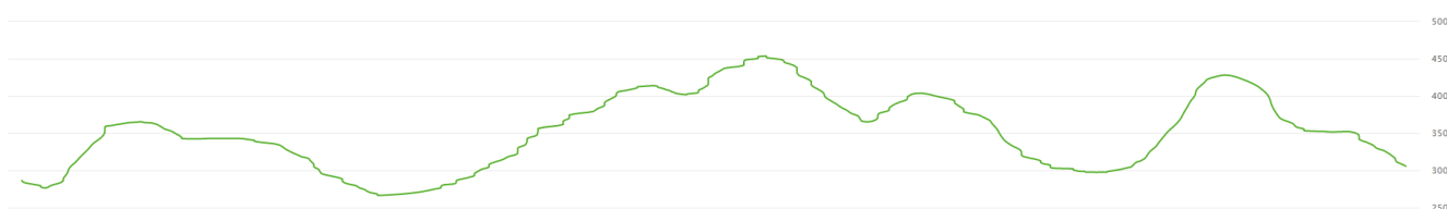
2 Promena uspona na stazi od 10 km